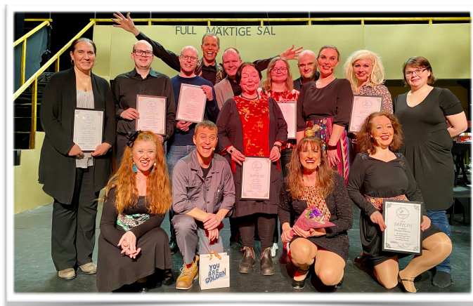
Diplomutdelning i Mölndal.

Ett stort arbete har även lagts ner med avseende på medlemservice, däribland de två enkäter som redovisats under rubriken Medlemmar (se ovan). Hemsidan har fortsatt att förbättrats. Merparten av den information som en medlem kan behöva finns lättillgängligt där.