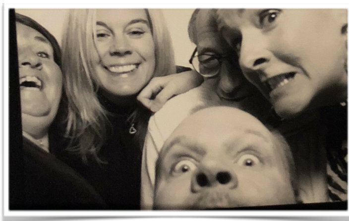
Delar av LIS:s styrelse inklämda i fotoautomat tillsammans med förbundssekreteraren och -hustrun