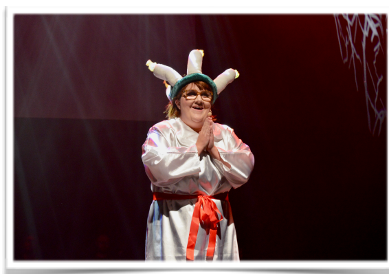
Lucia i augusti

Kulturföreningen Cabary från Karlstad stod som lokala arrangörer av 2017 års Revyfestival. C:a 300 delegater fanns på plats och alla hade bara positiva minnen av Revyfestivalen. Här var det närhetsprincipen som gällde - det var inte många meter mellan de olika lokalerna! Det bjöds på flera intressanta seminarier och underhållning. Dock lyste den beryktade solen i Karlstad enbart med sin frånvaro. LIS vill rikta ett stort tack till Kulturföreningen Cabary för ett mycket bra arrangemang.