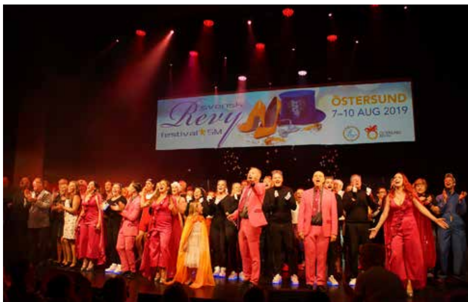
Kärlek - final med samtliga tävlande.