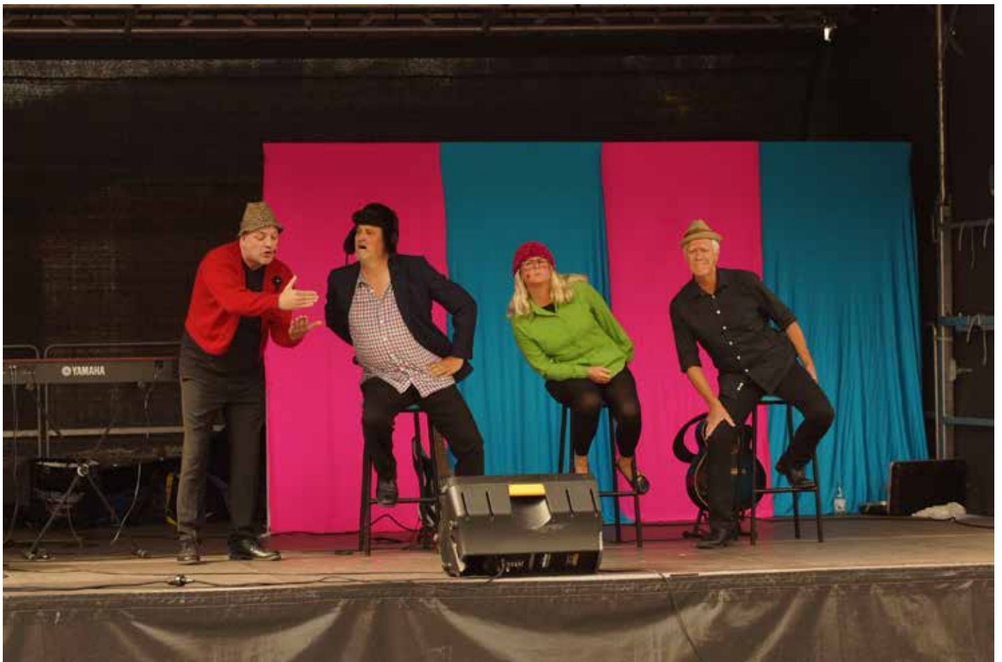
Lunchrevyunderhållning varje dag på Stortorget. Här kunde strövande besökare uppleva Österudsrevyn, Viggeryn, Tullmejsan, Iggesundsvyn, och Garvsyra - som här framför sketchen "Möte i Svenska Akademien", skriven av Bengt Larsson.