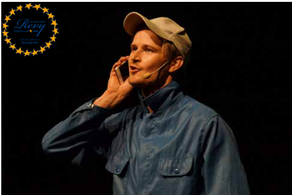
Hasses allservice - Mittrevyn.