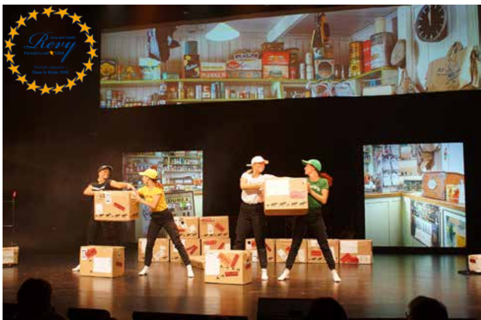
Olika bud - Iggesundsrevyn.