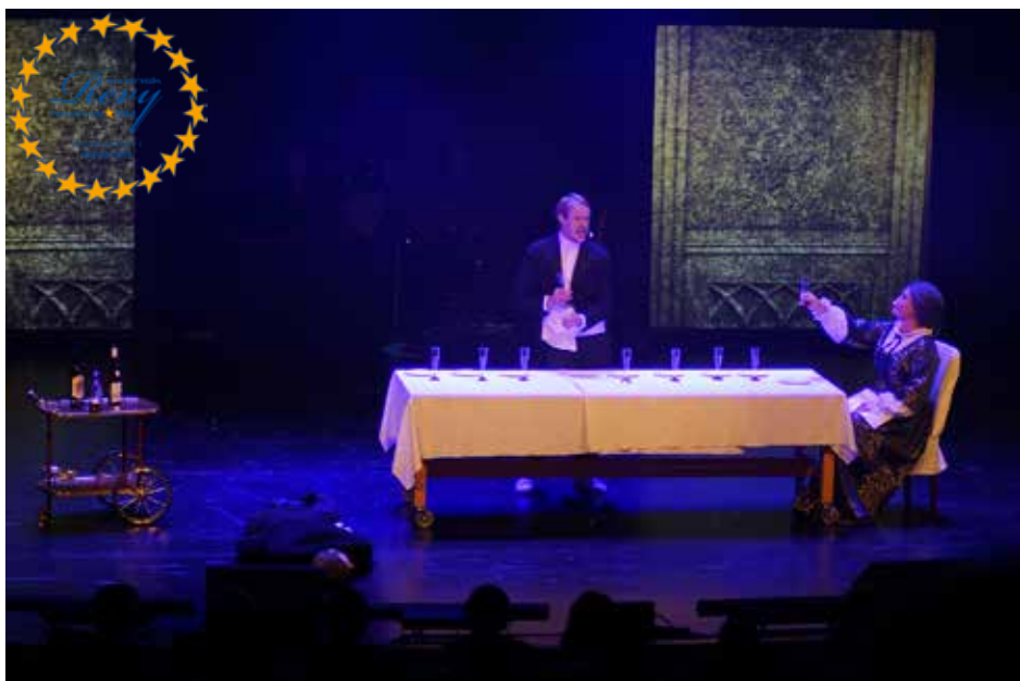
Grevinnan och betjänten - Mittrevyn. Foto: Stina Elg