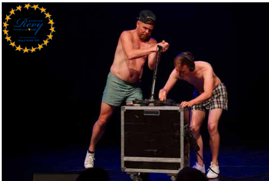
Köttbeat - Östersundsrevyn.