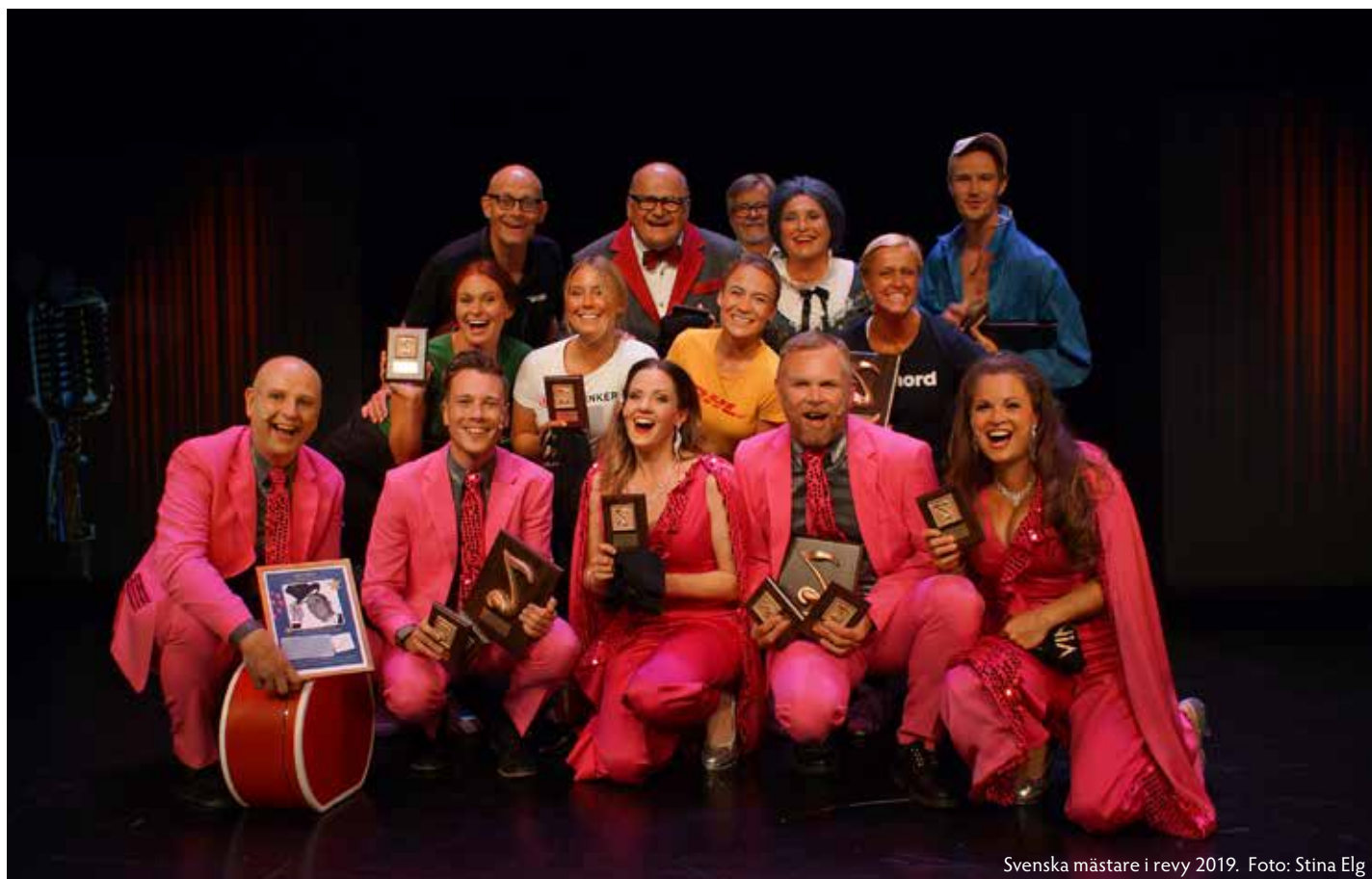
Svenska mästare i revy 2019.