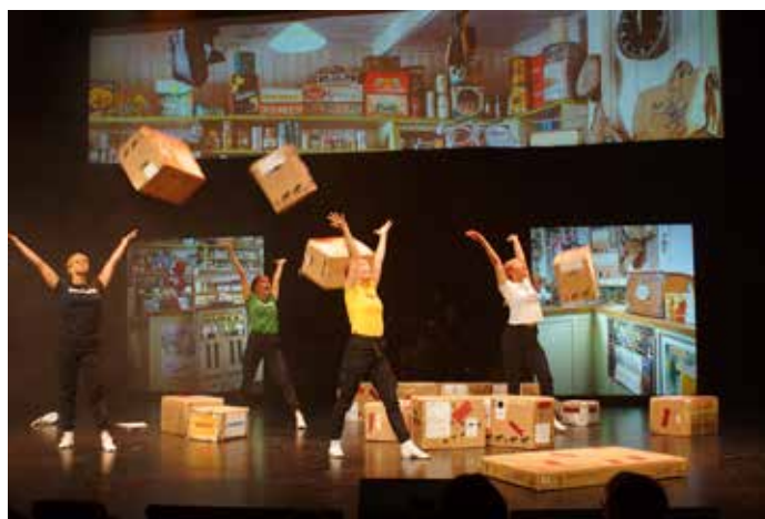
Sidan 10: Olika bud – Iggesundsvyn. SM-vinnare i Dans & Rytm.